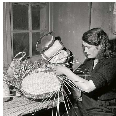
Beynat : reportage sur la fabrication des cabas. Arch. dép. de la Corrèze. 20 Fi 46.

Total : 31 panneaux de 40 x 40 cm + 1 affiche de 40 x 60 cm conditionnés dans 4 cartons de 60 x 80 cm.